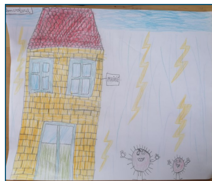
Le dessin de Tom